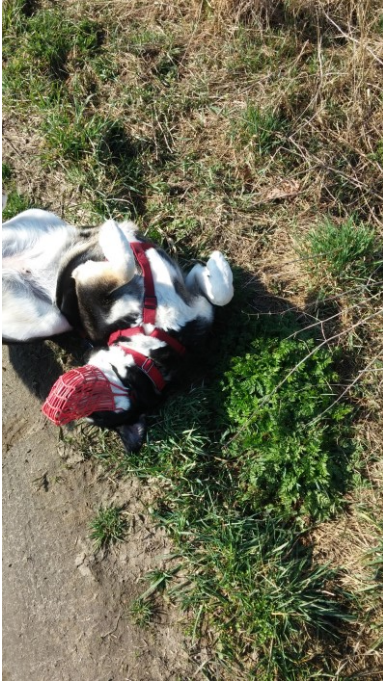
Daisy wälzt sich